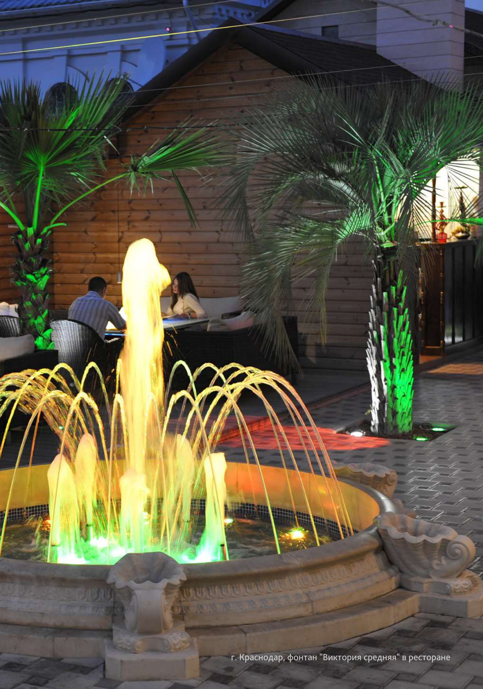
г. Краснодар, фонтан "Виктория средняя" в ресторане