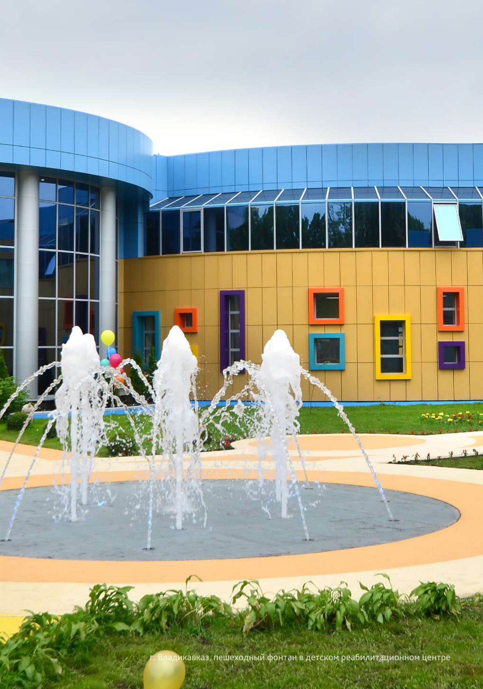
г. Владикавказ, пешеходный фонтан в детском реабилитационном центре