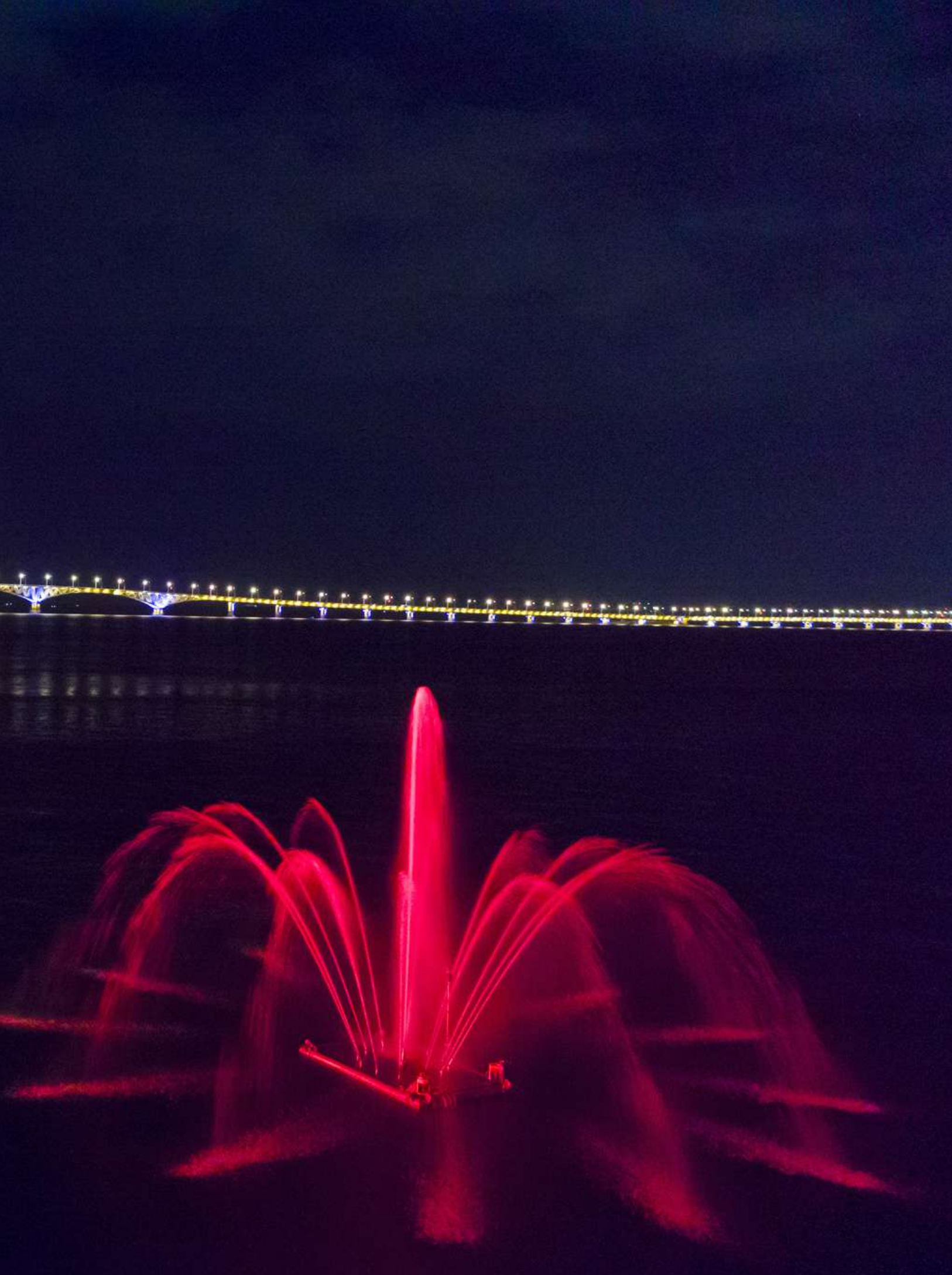
г. Саратов, плавающий фонтан "Сердце Волги"